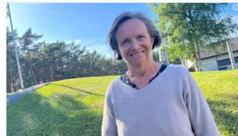
Hvaler trenger sårt et svømmeanlegg. - En kystkommune bør ha svømmeopplæring, sier lederen av Hvaler Idrettsråd.

- Hvaler er en kystkommune - vi trenger sårt et svømmeanlegg