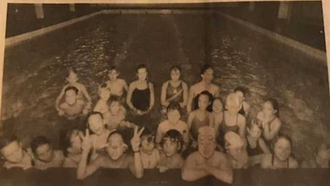
Altfor liten bassengkapasitet til

Kva som må prast med dette er ikkje Styve vil om. — Me treng eit konkurransebasseng målet for slik at dette på det som anlegg, idrettsanlegg, hall ty steg. Også opplæringskapasitet enorr hald tren ne. ta 15 N pa de tr ne st g l