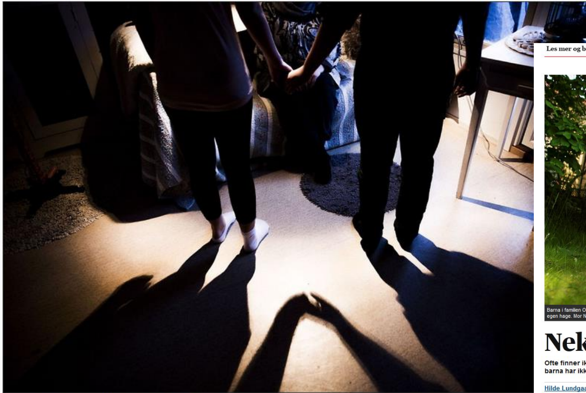
HAR IKKE RÅD TIL IDRETT: En familie i Bærum har måttet begrense barnas deltakelse i idrett på grunn av trang økonomi. De er ikke de eneste.

** Mor i Bærum måtte be sønnen slutte med fotball - ble for dyrt