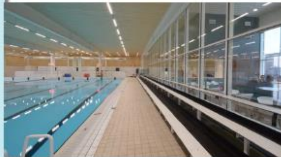
Above: view of the timber facade cladding. Right: interior of the pool.